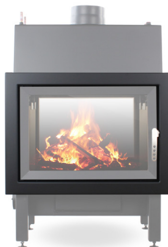
EGRA Twin 90°

EGRA Twin 90° - Art.-Nr.: E/TW/00/W/1/0001