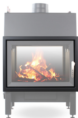
EGRA Twin 90° S

EGRA Twin 90° S - Art.-Nr.: E/TW/00/W/1/0002