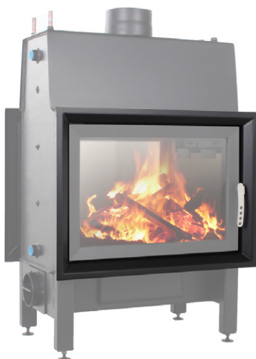
EGRA Twin 45°

EGRA Twin 45° - Art.-Nr.: E/TW/00/W/2/0001