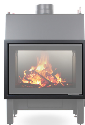
EGRA Glass Twin 90° S

EGRA Glass Twin 90° S - Art.-Nr.: E/GL/TW/W/1/0002