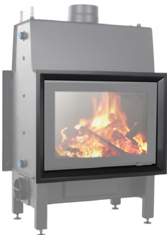
EGRA Glass Twin 45°

EGRA Glass Twin 45° - Art.-Nr.: E/GL/TW/W/2/0002