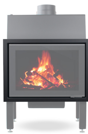
EGRA Glass 90° S

EGRA Glass 45° - Art.-Nr.: E/GL/00/W/1/0001