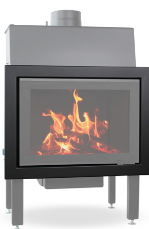
EGRA Glass 90°

EGRA Glass 90° - Art.-Nr.: E/GL/00/W/1/0001