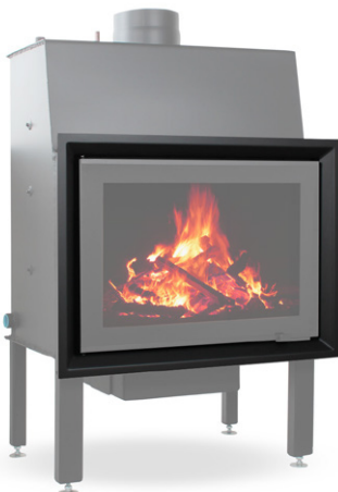
EGRA Glass 45°

EGRA Glass 45° - Art.-Nr.: E/GL/00/W/2/0001